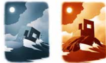
Blauwe en rode platen

In de platen van de Tienerbijbel vind je soms geheime tekens terug. Hieronder zie je er een paar. Kijk, lees en ontdek zelf wat ze te betekenen hebben!