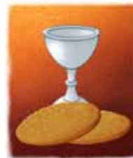
Brood en wijn